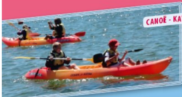
CANOË - KAYAK