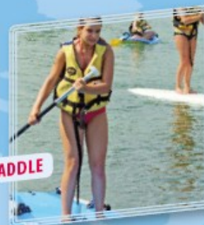
STAND UP PADDLE